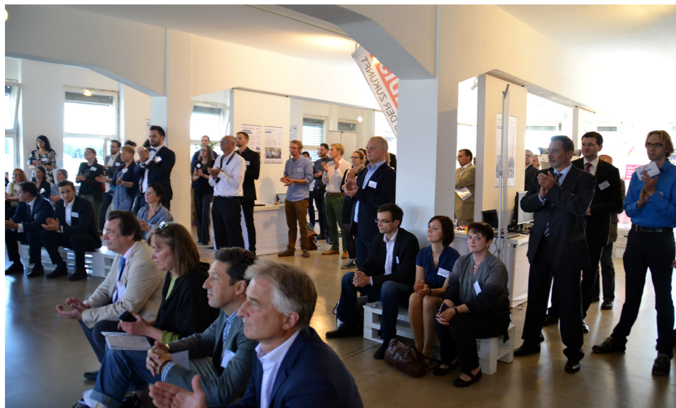
1. Neuköllner Unternehmensbörse am 2. September 2015