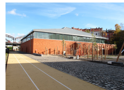
Sporthalle an der Hertabrücke