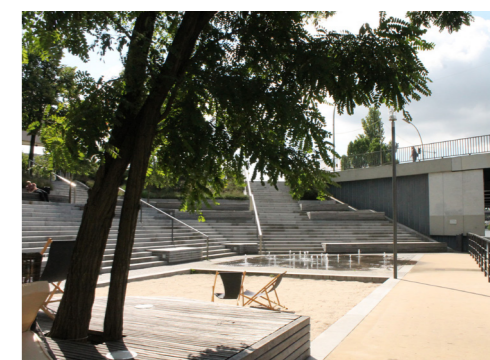
Uferpromenade mit Treppenanlage an der Sonnenbrücke