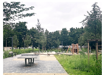
Spielfläche in der Mehrower Allee vor Projektbeginn