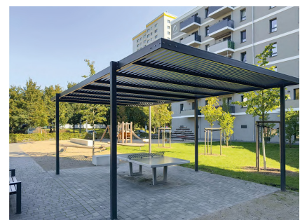
Die neue Pergola für den Nachbarschaftstreffpunkt Mehrower Allee 28-30